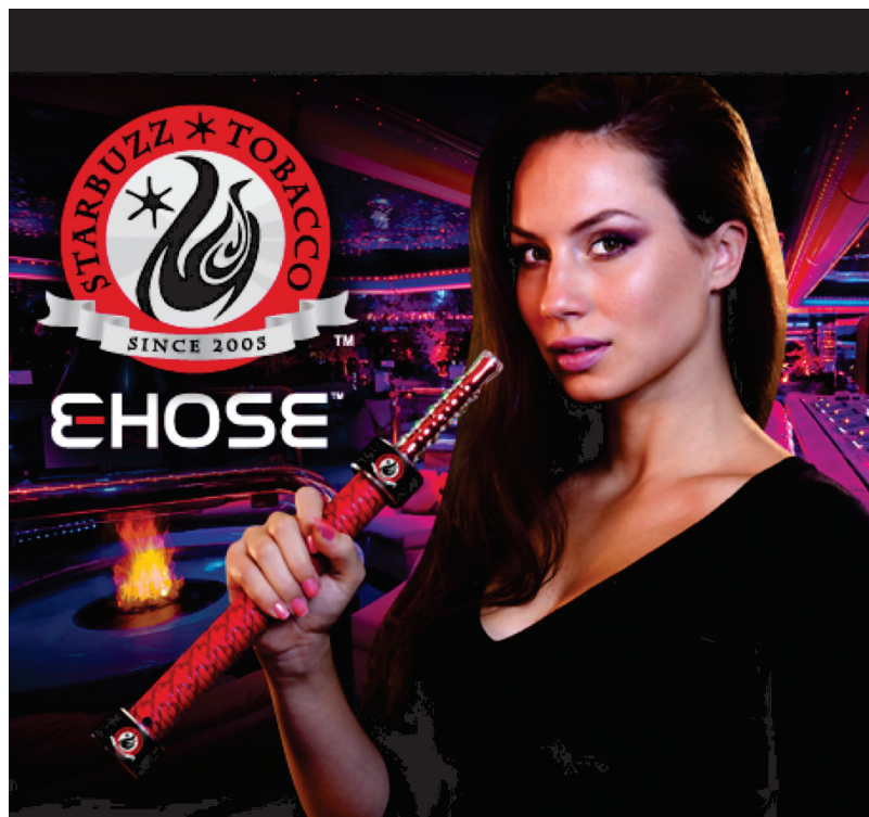
Figura 4 – Propaganda do narguilé eletrônico E-Hose