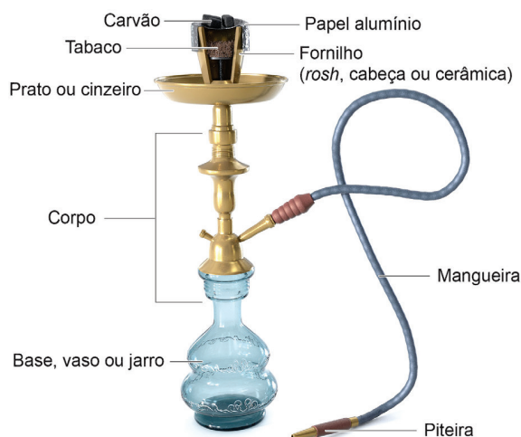
Figura 7 – Estrutura do narguilé