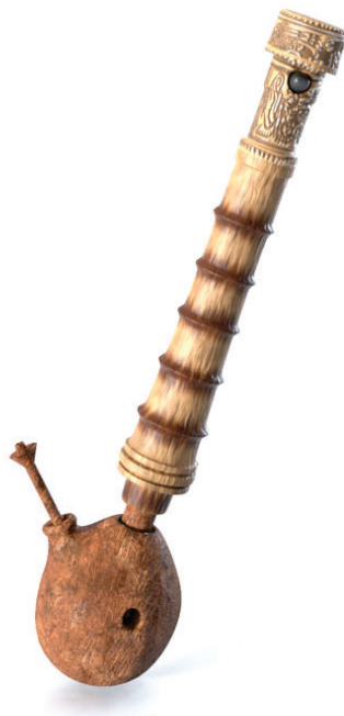
Figura 3 – Bong, o narguilé chinês