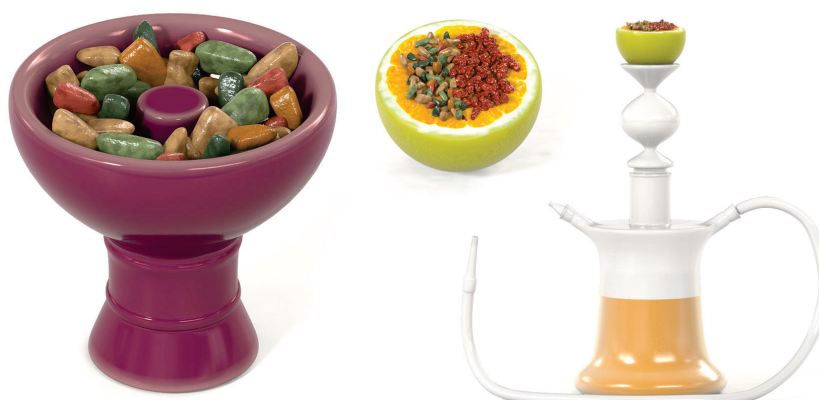
Figura 10 – Steam Stones