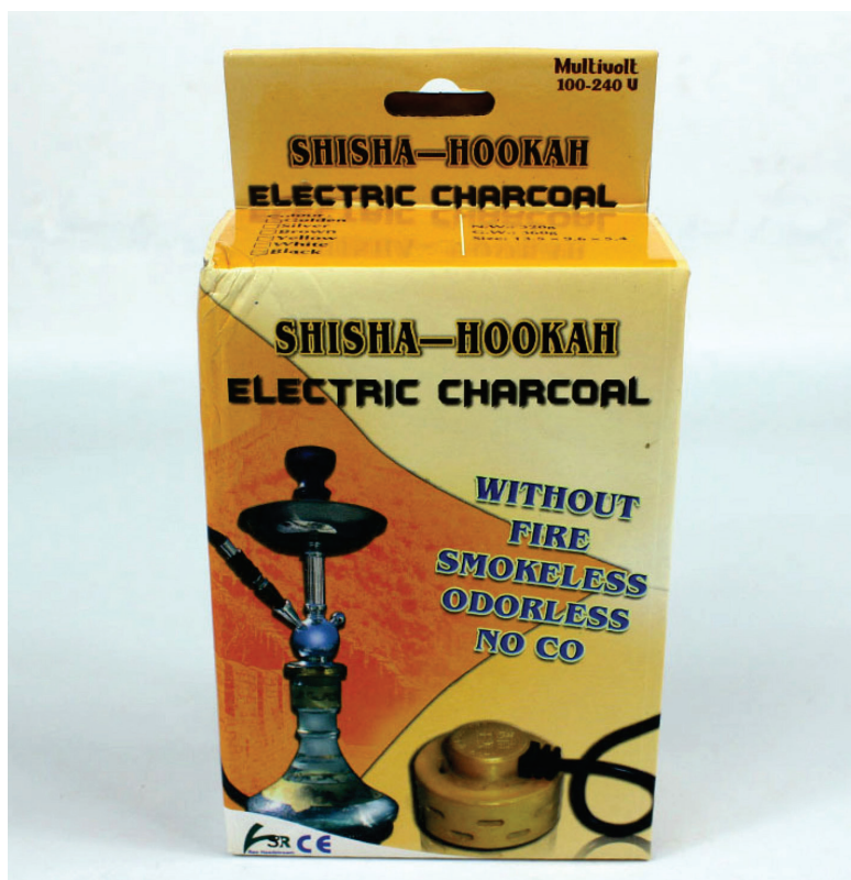
Figura 9 - Propaganda e-carvão