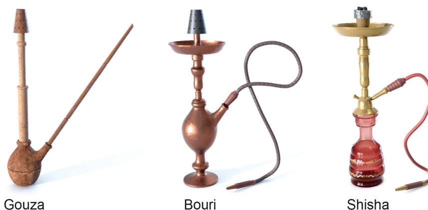
Figura 2 – Diferentes tipos de narguilé