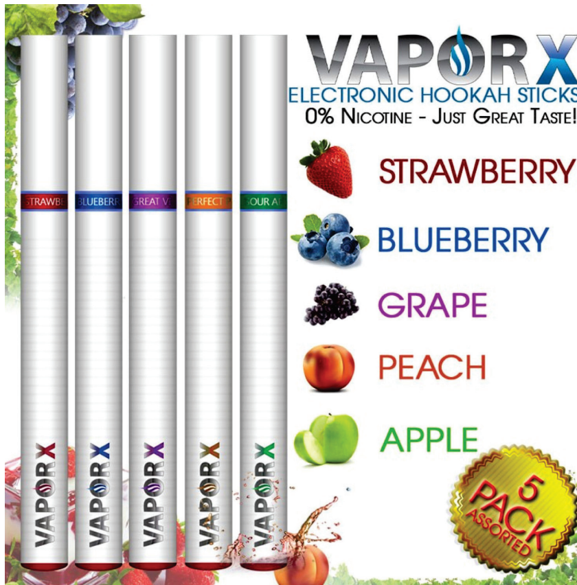
Figura 5 – Propaganda do narguilé eletrônico Vaporx