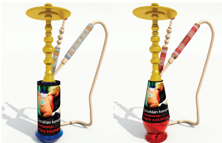
Figura 11 – Rótulos de advertência de saúde em narguilés da Turquia