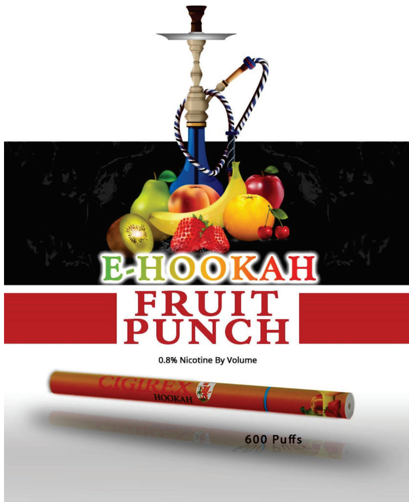
Figura 6 - Propaganda do narguilé eletrônico E-Hookah