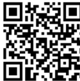
QR Code para versión en PT