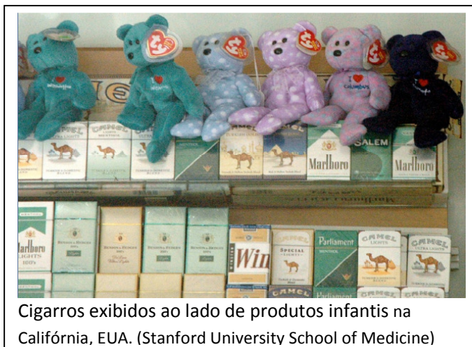
Cigarros exibidos ao lado de produtos infantis na Califórnia, EUA.