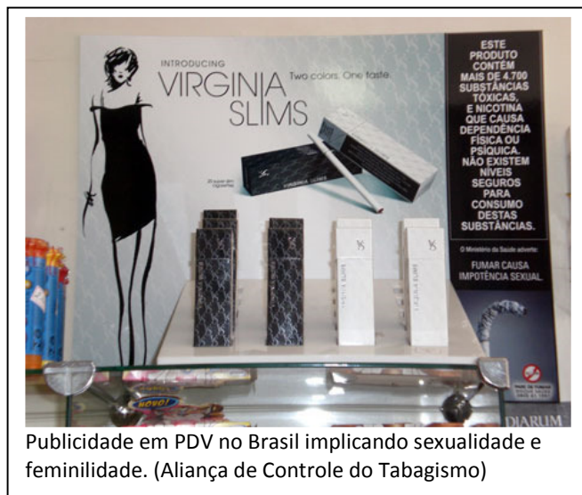
Publicidade em PDV no Brasil implicando sexualidade e feminilidade. (Aliança de Controle do Tabagismo)