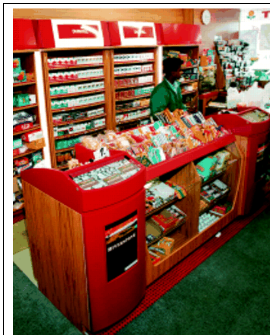
Cores para o Dunhill na Nova Zelândia. (Fraser, T. Phasing out POS tobacco advertising in New Zealand. Tob Control , 1998.)